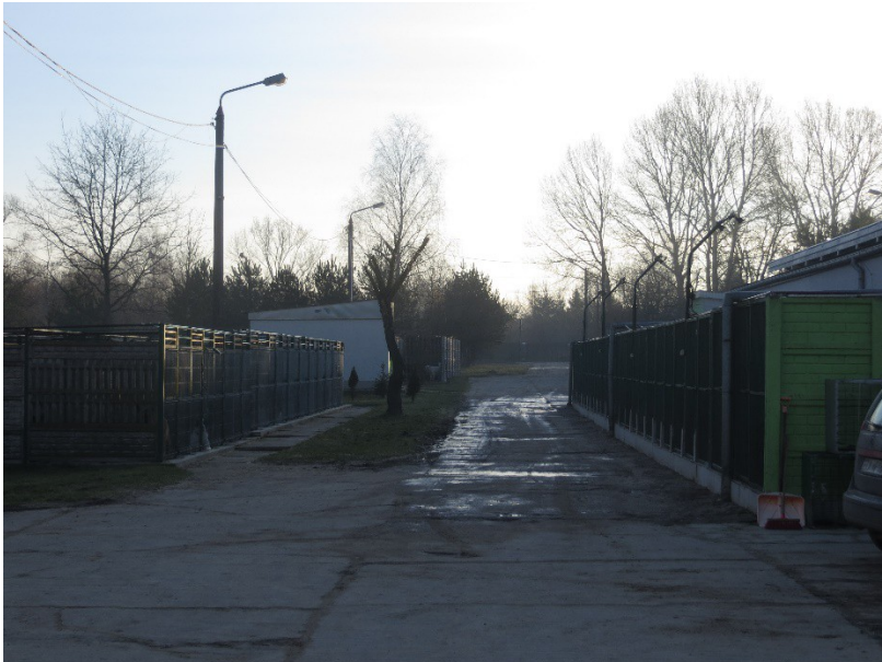
Freitag frühmorgens – einige sind schon wach