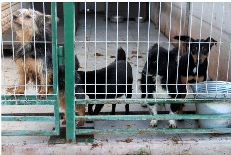
so nette Hunde warten...