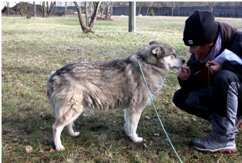
süsse Hundeeoma, die schon in Wojtyszki war