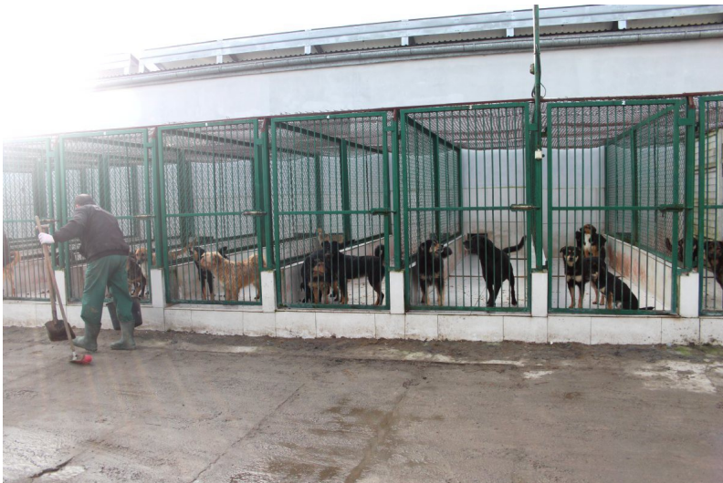
Morgendliches Säubern. In Box 4 sitzt Barry, der im März ausreisen wird