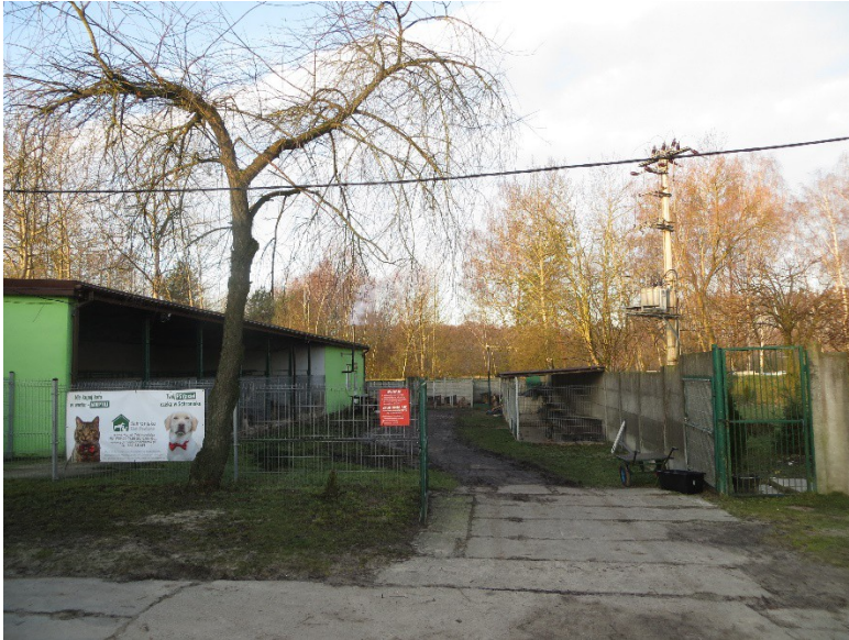
Morgenlicht über den Wembley-Ausläufen