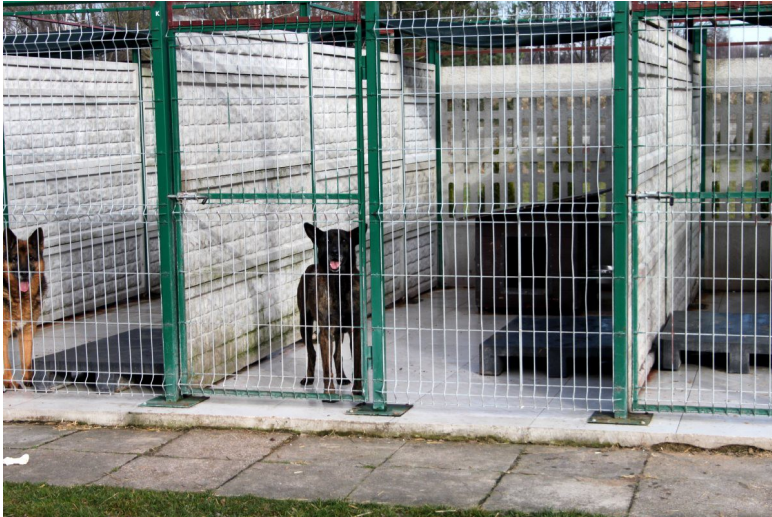
DRAGON, seit 10/2017 ist er hier, bald wird er 14 Jahre