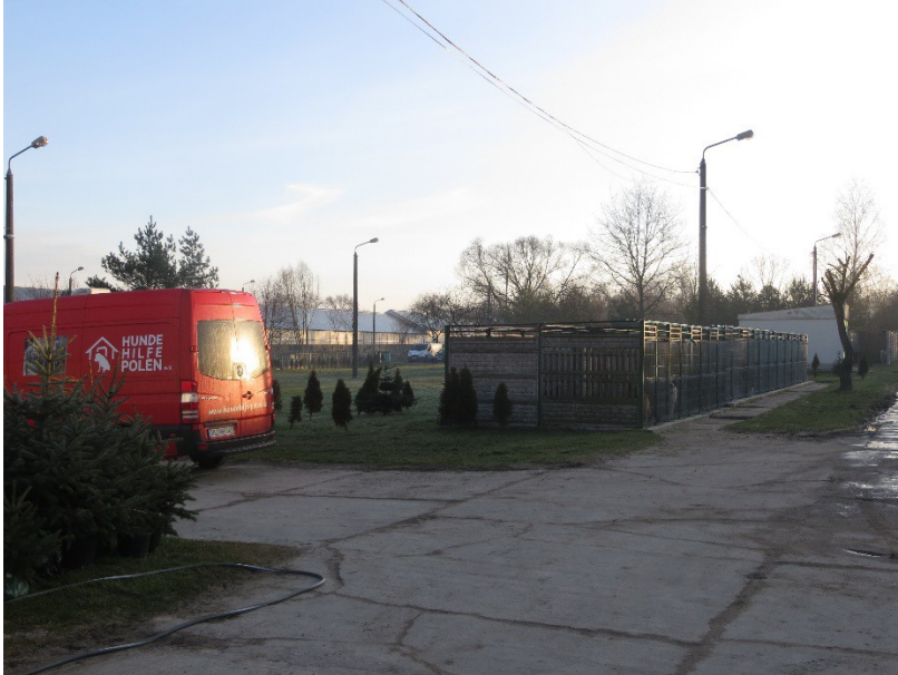
Sprinter im Morgenlicht