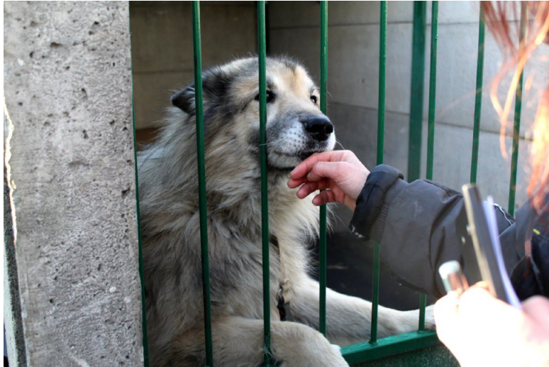
Schönheit in der Quarantäne – und so lieb